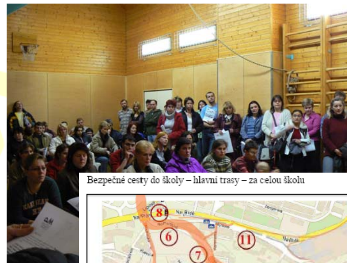
Bezpečné cesty do školy – hlavní trasy – za celou školu