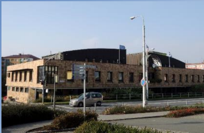
Městský úřad Otrokovice radnice z r. 1993 (arch. Kuchlovský)