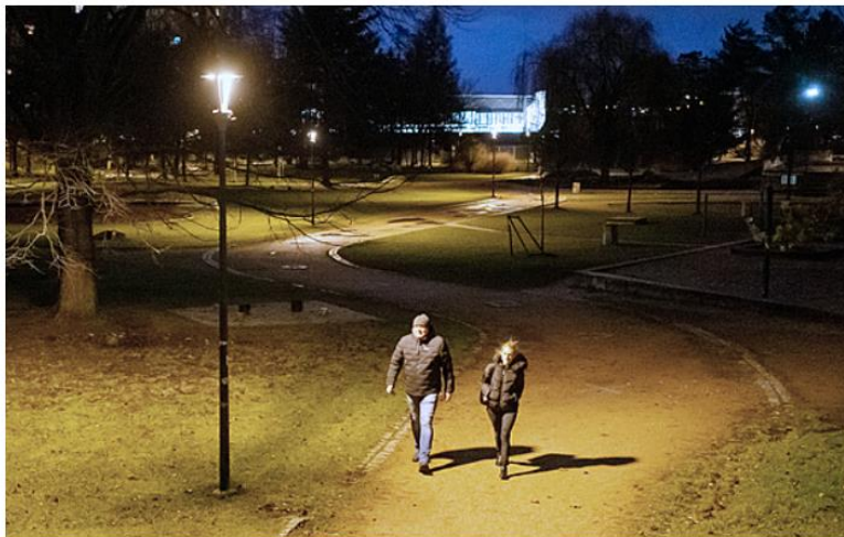
Některá města se snaží ušetřit na veřejném osvětlení.

Radnice reagují na zdražování energií – montují LED svítidla, plánují fotovoltaické elektrárny. V dohledné době jim totiž končí fixace cen. Velké problémy musejí řešit například v jihočeském Písku, kde pro letošní rok odhadují až dvaapůlkrát vyšší náklady oproti minulému roku